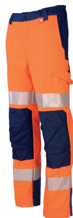
Orange Fluor/Marine 701020HVO