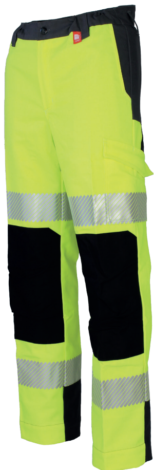
Jaune Fluor / Charcoal 128