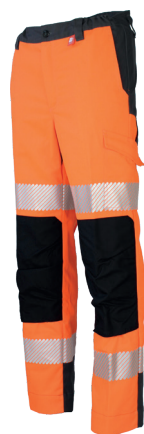
Orange Fluor/Charcoal 701730HVO