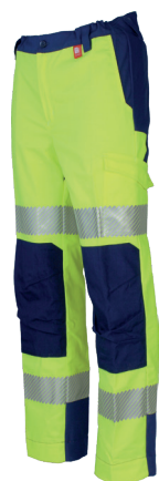
Jaune Fluor/Marine 701020HVJ