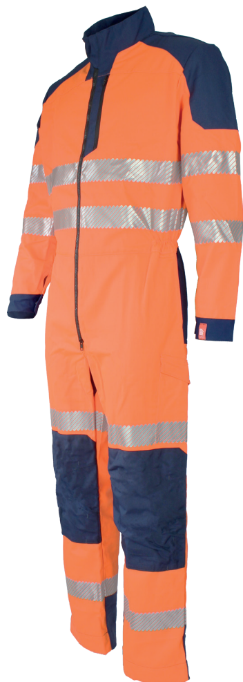
Orange Fluo/Marine 750020HVO