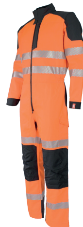
Orange Fluo/Charcoal 750730HVO