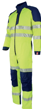
Jaune Fluo/Marine 750020HVJ