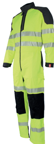
Jaune Fluo/Charcoal 750730HVJ